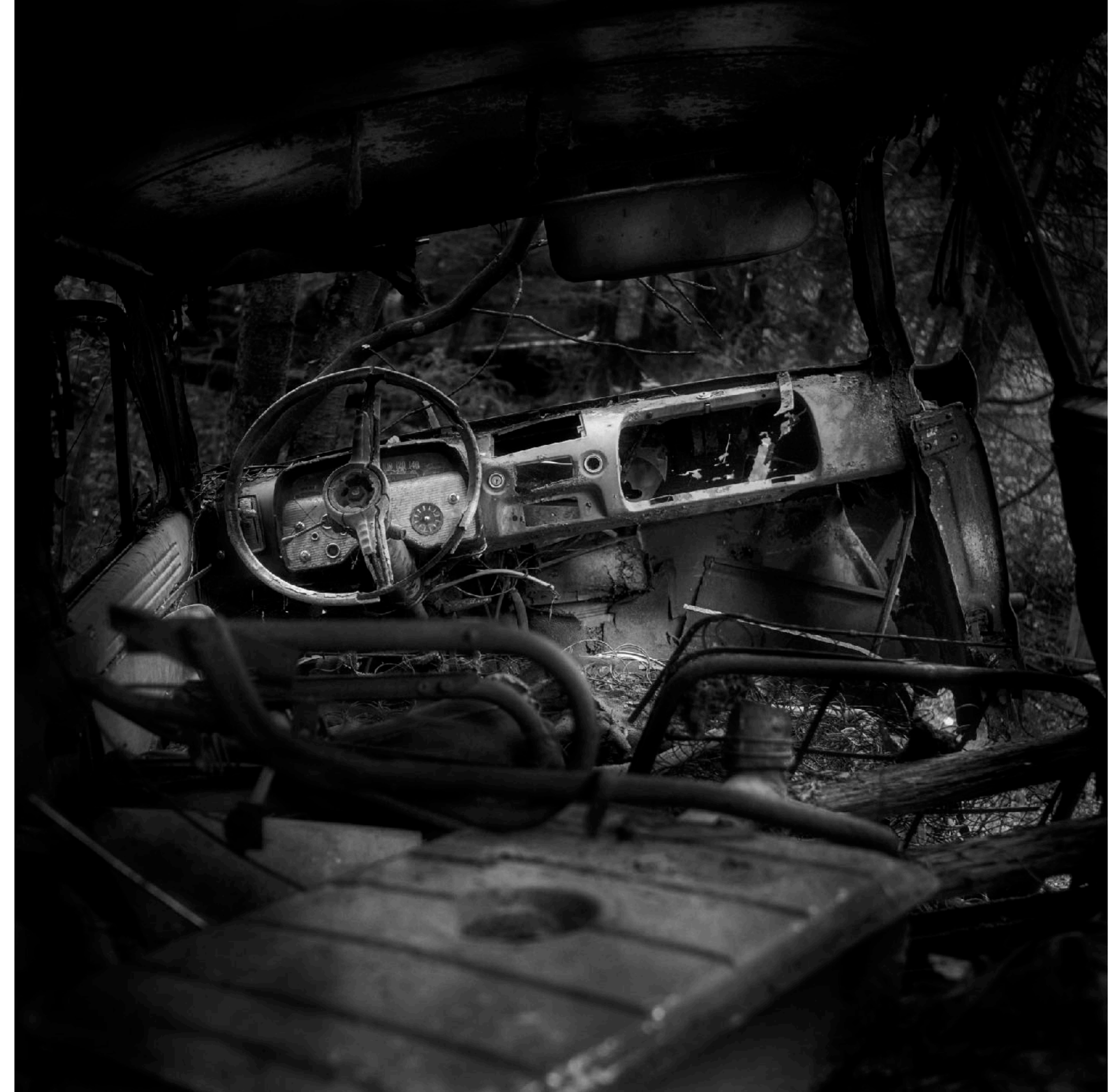
Opel Kapitän fanns det en hel del av i Sverige men inte i kombiutförande. Den här är utrustad som likbil.