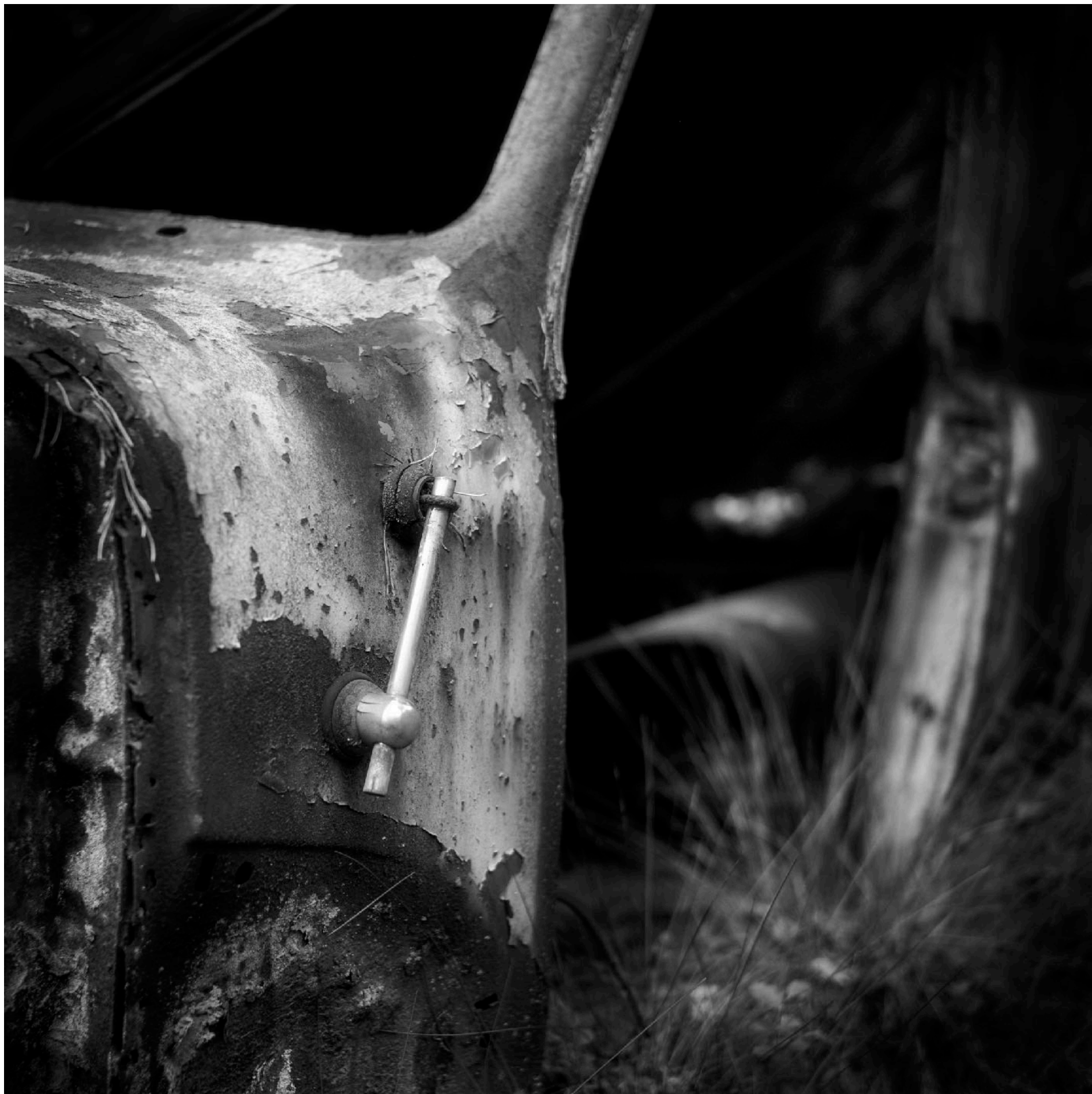
Volvo finns naturligtvis också representerad på bilkyrkogården, här i form av en PV 444 med en fin antenninstallation.