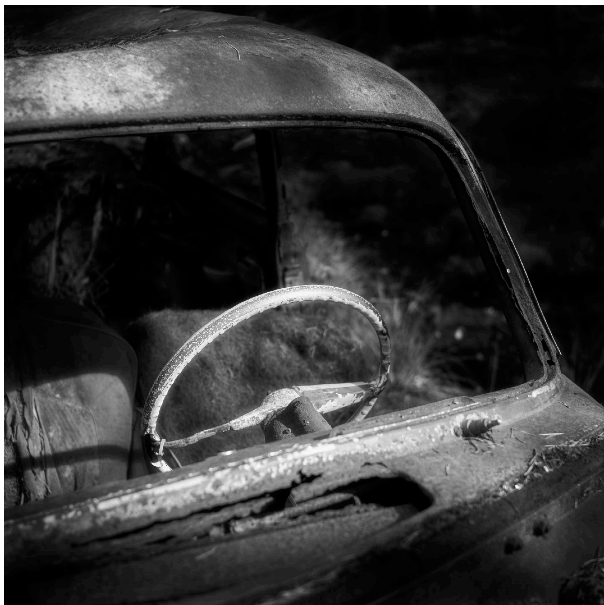
En Opel Olympia från 1955 är en av de bilar som sakta rostar sönder på myren. Till och med ratten i backelit vittrar sönder.