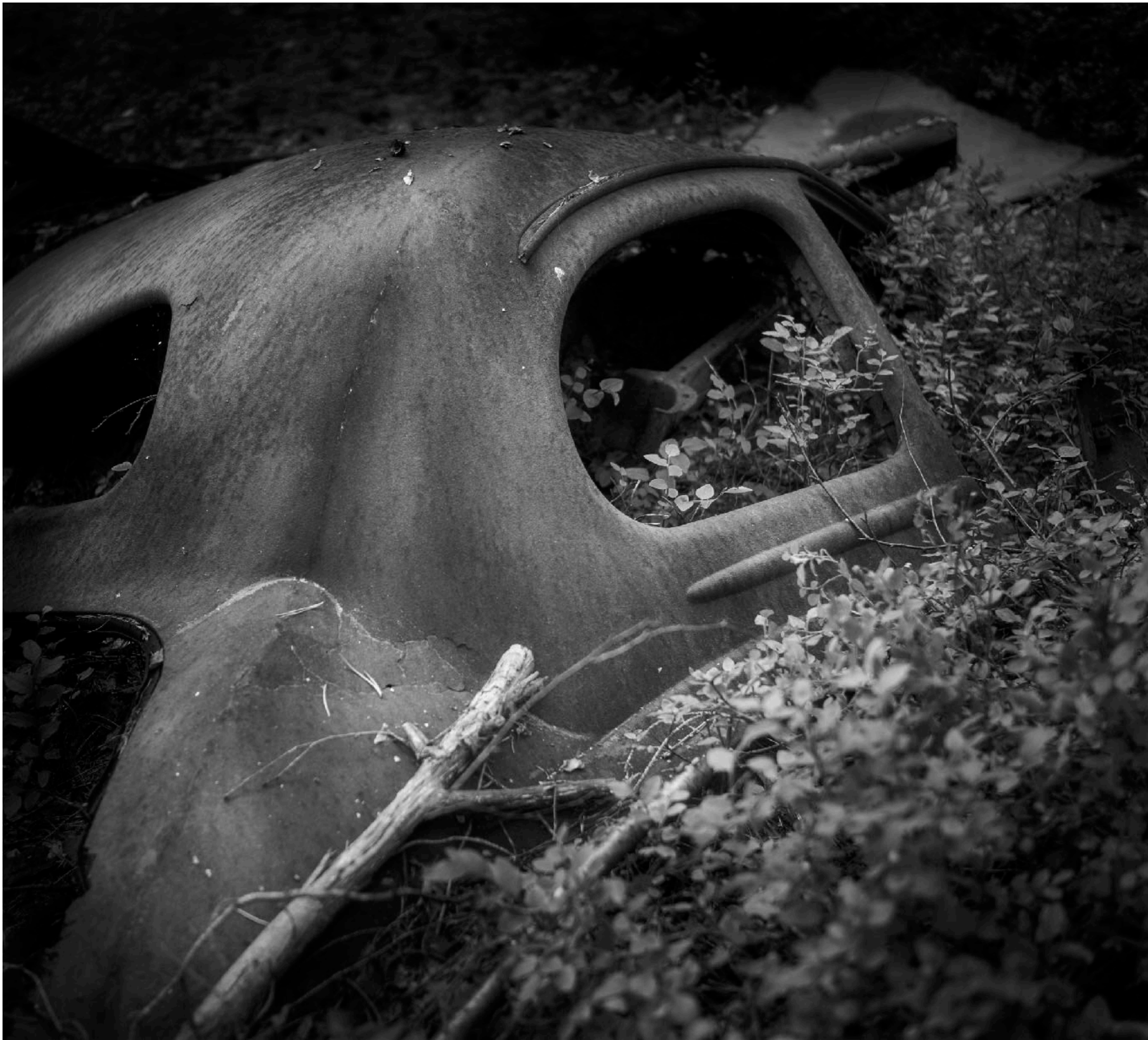
Bilvraken bryts långsamt ner och flera av dem har börjat sjunka ner i mossen . Så det gäller att besöka Kyrkö mosse innan allt är borta. Ingen vet heller vad som händer när det 49-åriga bygglovet går ut.