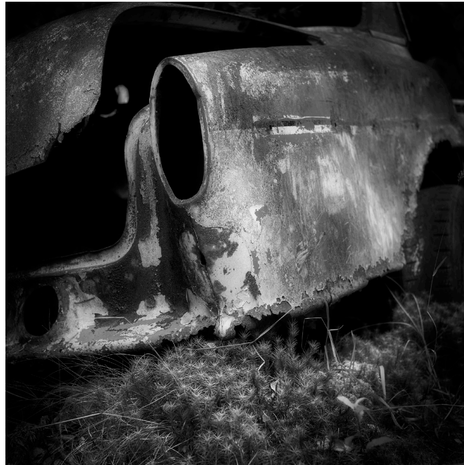
Några Volvo Amazon finns också bland de totalt ca. 150 bilar som står här idag.