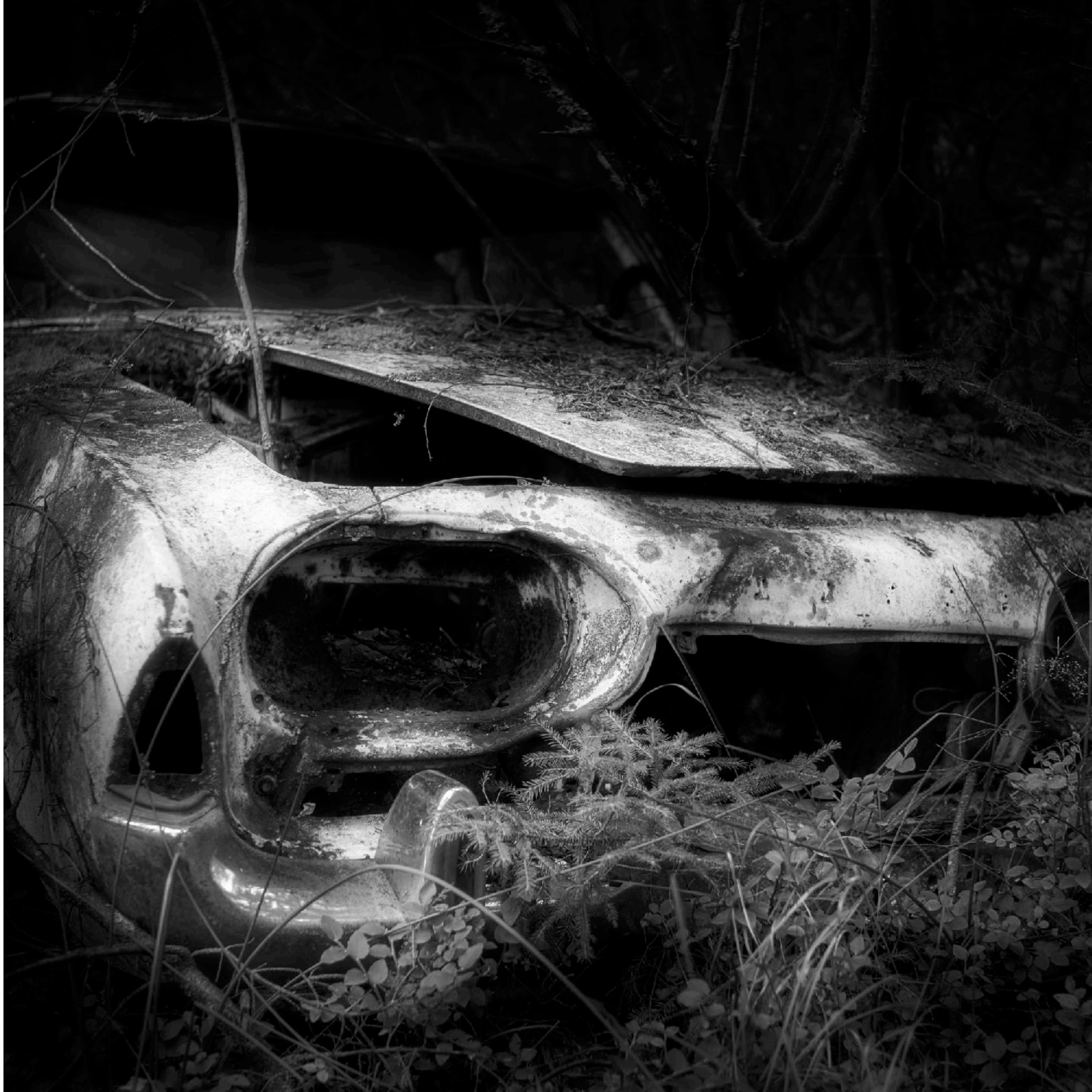
Ford Taunus som den såg ut mellan 1960 och 1964.