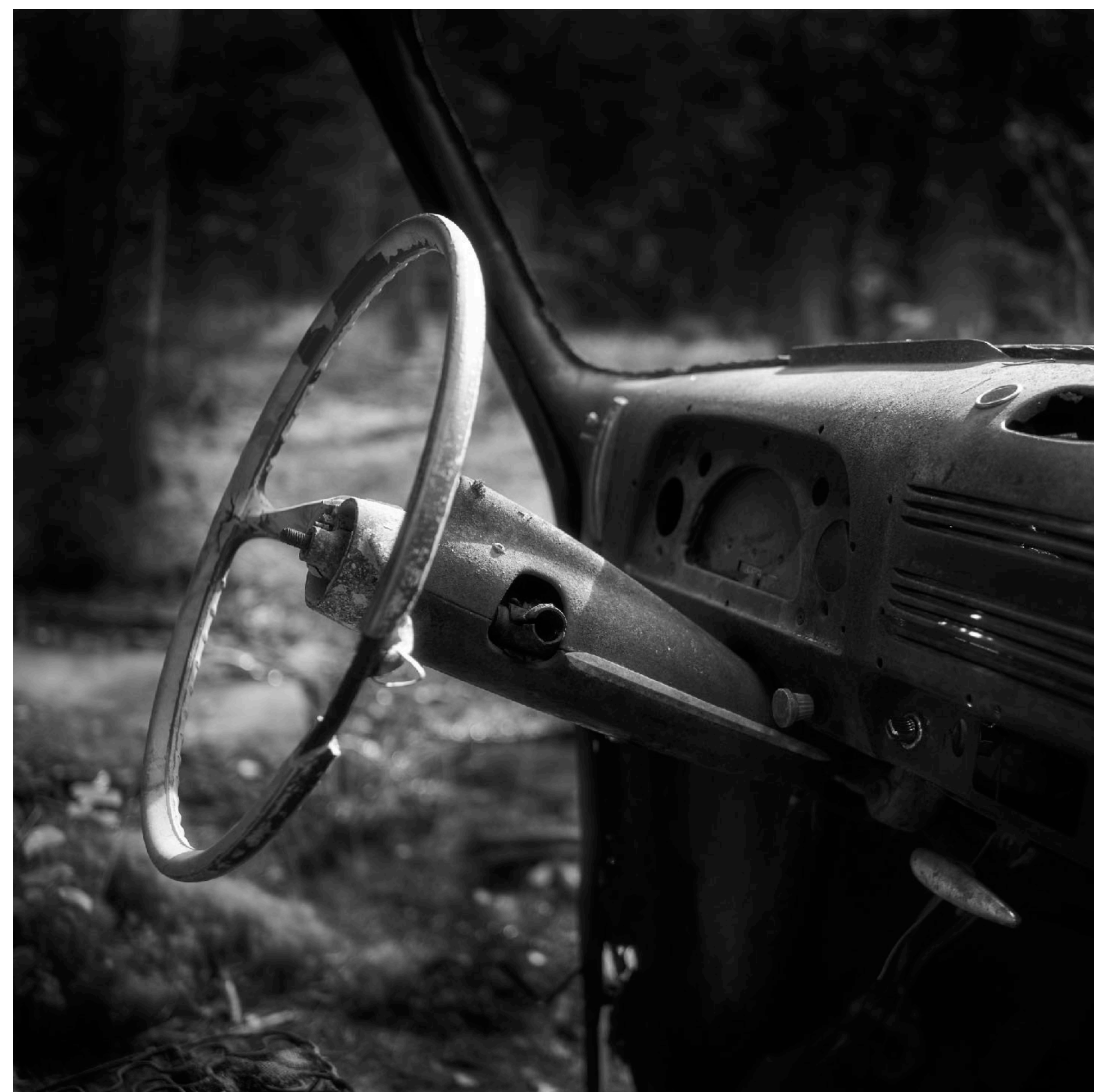
Man kan också tydligt se att många delar av inredningen var i metall förr i tiden och inte av plast som idag