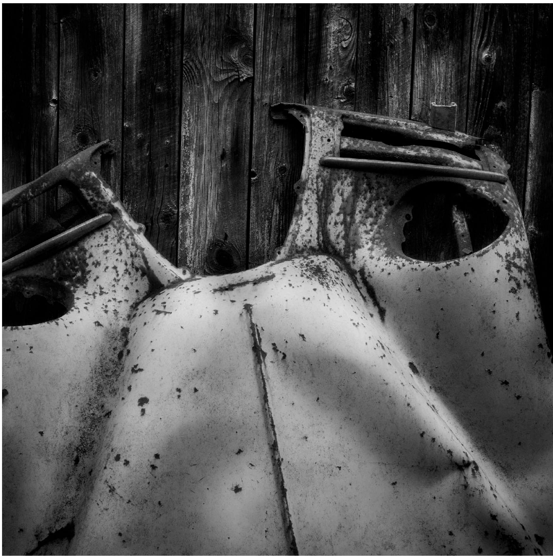
SAAB sålde också bra på 1950 och 1960-talet. Här en motorhuv till en SAAB 93 och till höger baksätet till en SAAB 96.