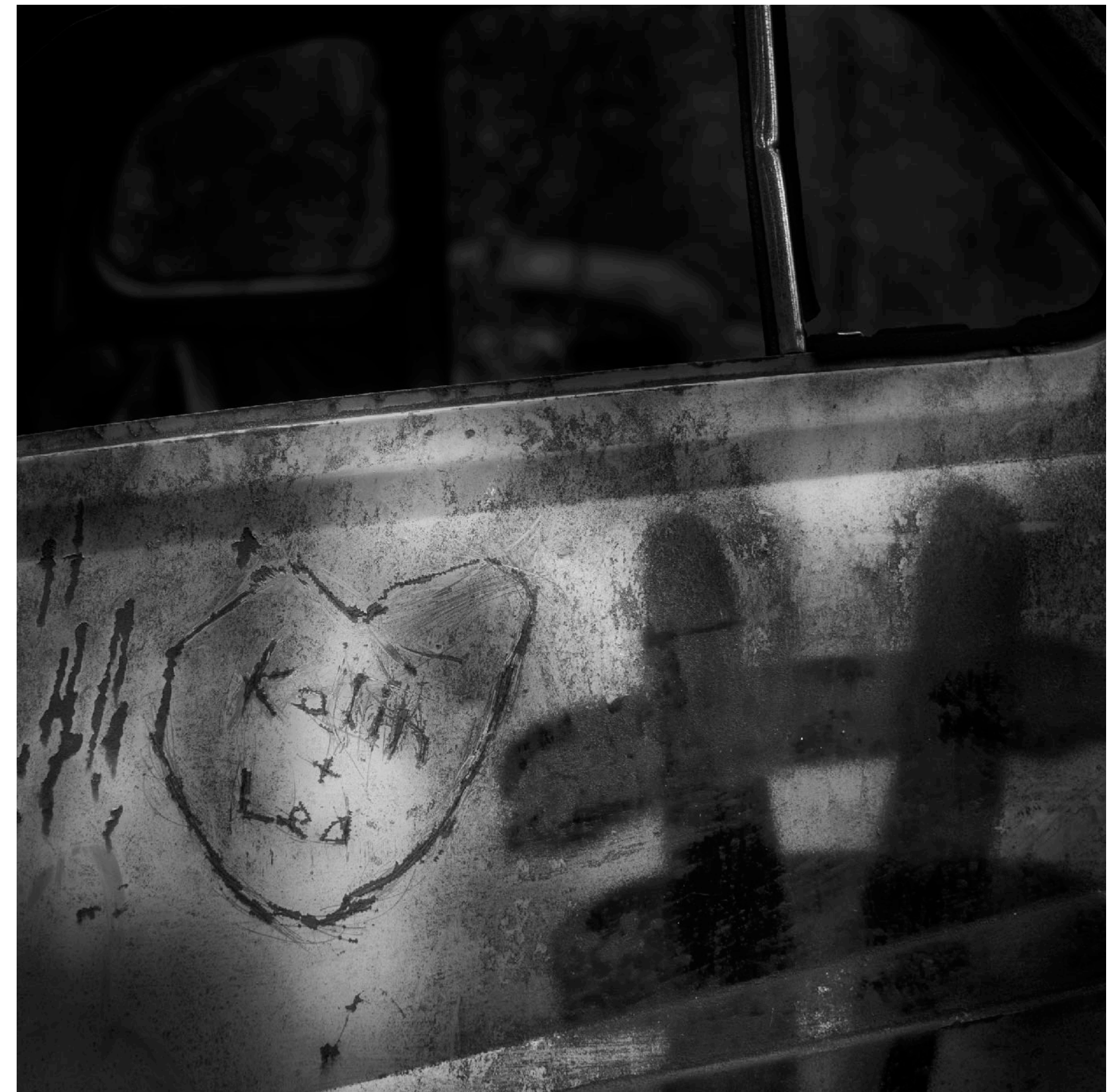
Standard Eight var en annan populär småbil i Sverige på 1950-talet.