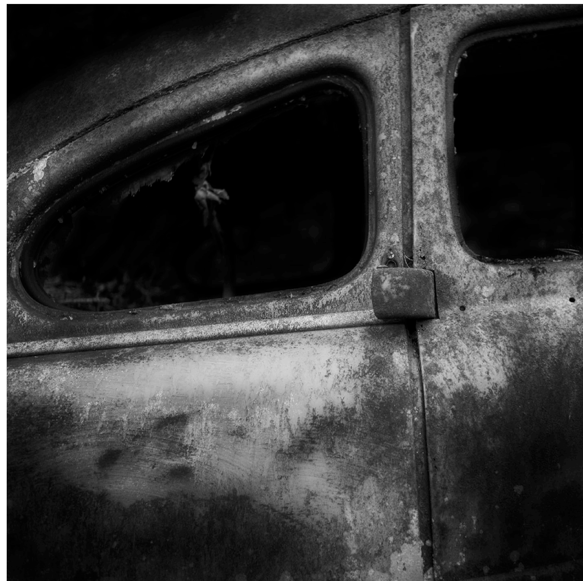
Bakhängda dörrar var heller inte ovanligt på 1950-talet, en lösning som ofta kallades för kidnappardörrar.