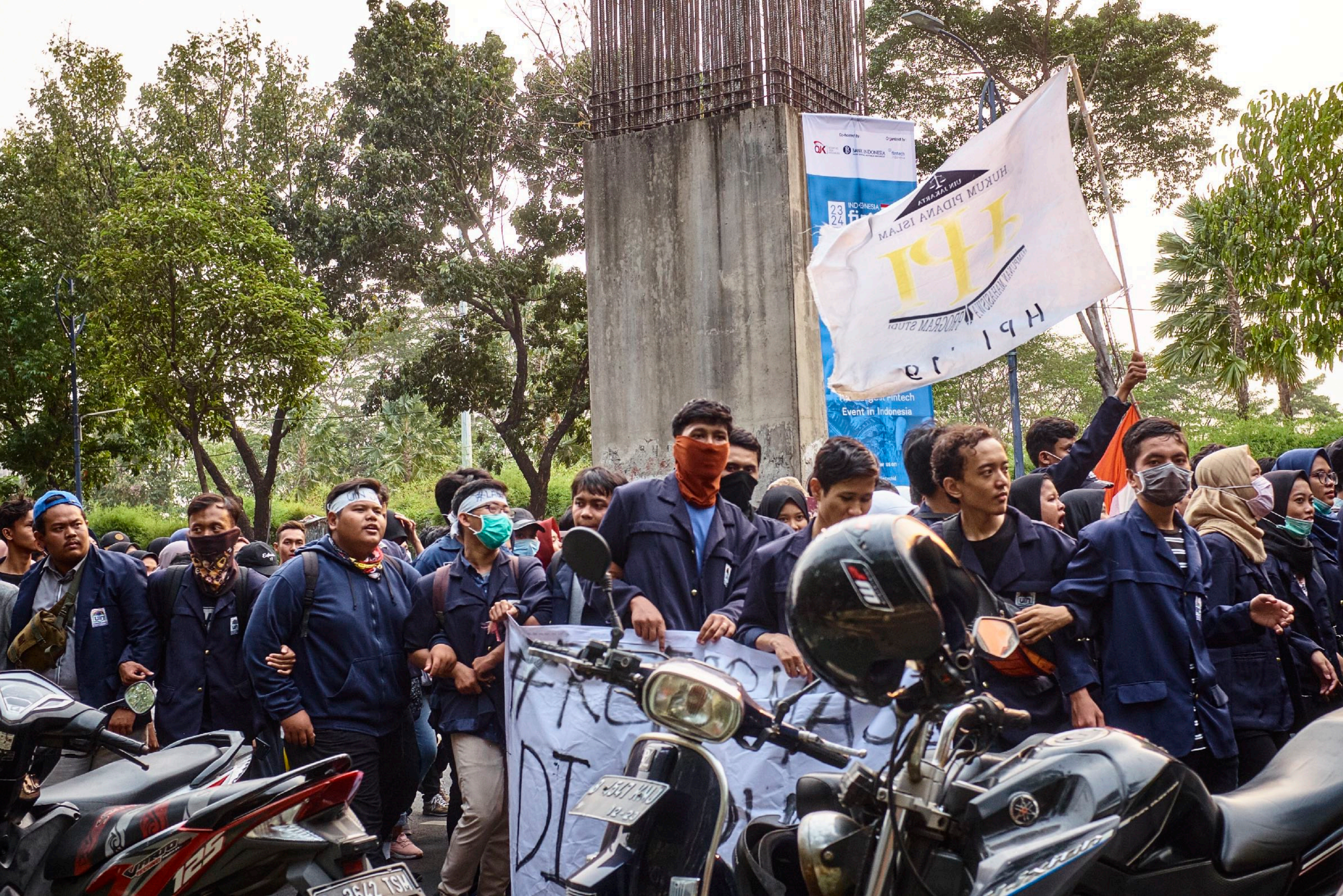
Studentdemonstrationer i protest mot den sittande regeringen.