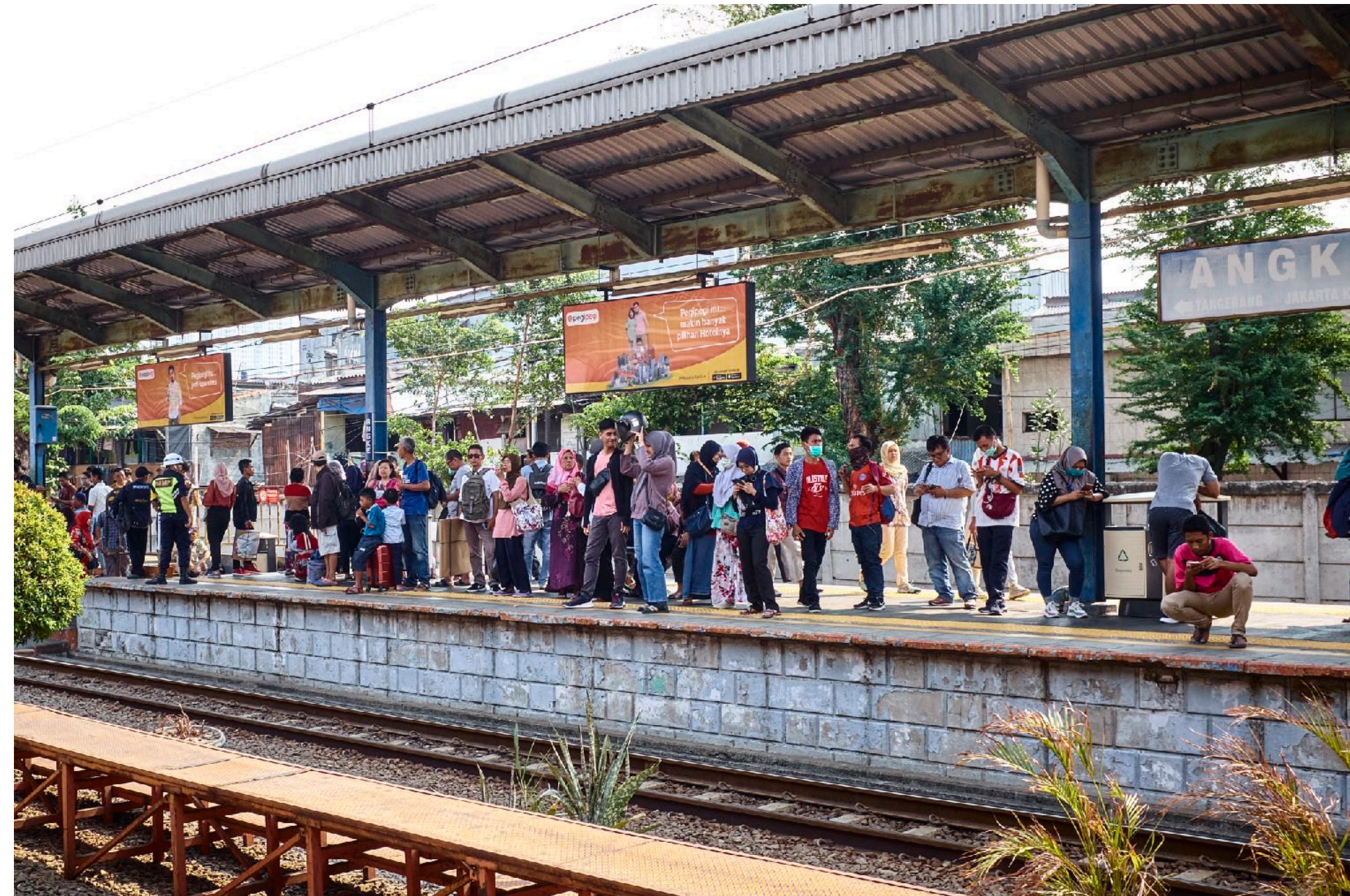
Ett lokaltåg transporterar befolkningen mellan den rika och den fattiga delen av Jakarta.